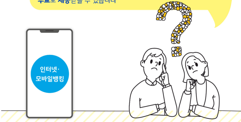
은행별 조회채널 및 조회방법(채널, 화면 메뉴)

거래은행 영업점을 방문하거나 인터넷·모바일뱅킹에 접속해 ‘금융거래종합보고서’ 서비스를 신청하면, 무료로 제공받을 수 있습니다