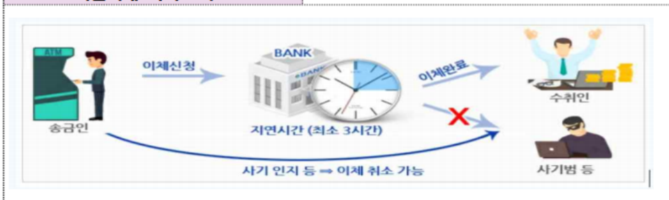
< 지연이체 서비스 구조 >

※ 동 서비스는 해당 금융회사 인터넷(스마트)뱅킹, 영업점 방문을 통해 신청할 수 있으며, 은행마다 서비스 내용에 차이가 있을 수 있음