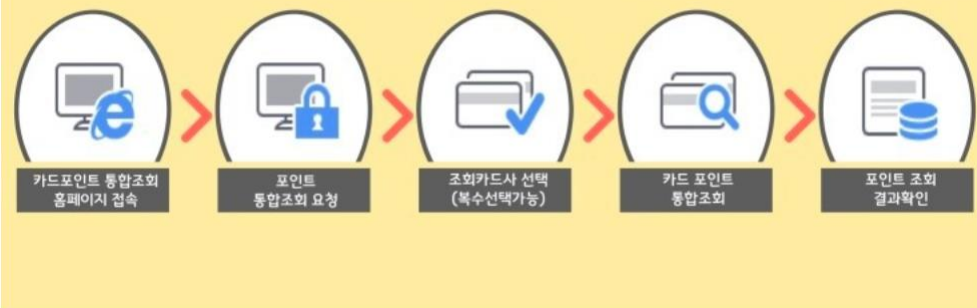
카드 포인트 통합조회시스템 이용절차

금융감독원 파인(fine.fss.or.kr)의 카드 포인트 조회 또는 여신금융협회 조회 시스템 (www.cardpoint.or.kr)에서 카드사별로 잔여포인트, 소멸예정포인트, 소멸예정일 등을 통합 조회할 수 있습니다.