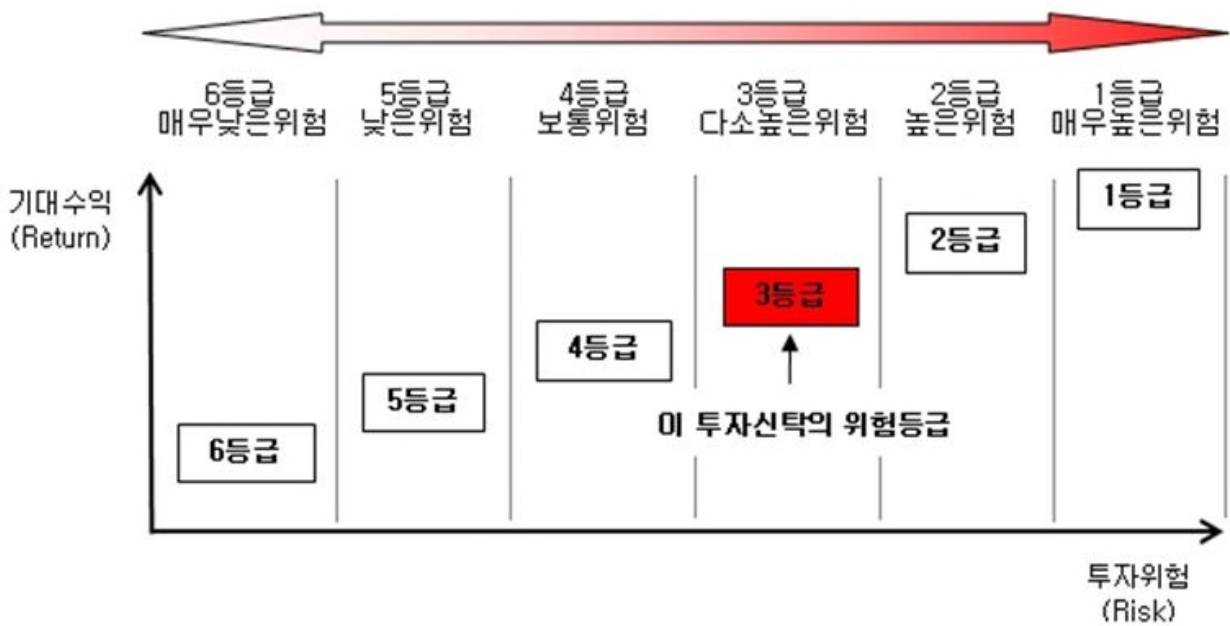
[집합투자기구 위험등급 분류기준 (97.5% VaR 모형 사용)]