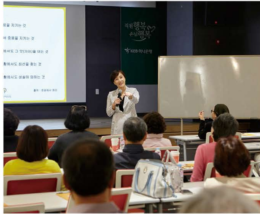
가정의 달 맞이 VIP 손님 초청