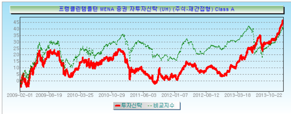
[대표클래스의 수익률 그래프]

주2) 비교지수의 수익률에는 운용보수 등 집합투자기구에 부과되는 보수 및 비용이 반영되지 않았습니다.