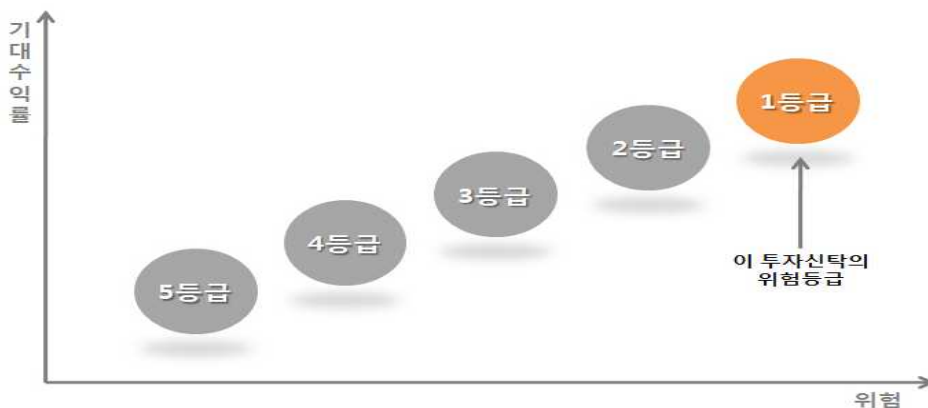
[ 이 투자신탁의 위험등급분류 ]

이 투자신탁은 여타 자산보다 변동성이 높은 주식 등에 투자하는 모투자신탁에 투자하기 때문에 5개의 투자위험등급 중 위험도가 높은 1등급으로 분류됩니다. 따라서 이 투자신탁은 글로벌시장의 경제여건 변화와 글로벌 주식의 가치변동이 상관관계가 있음을 이해하며 외국통화로 표시된 글로벌주식과 관련된 투자위험을 감내할 수 있고 투자원본 손실이 발생할 수 있다는 위험을 잘 아는 투자자에게 적합합니다.