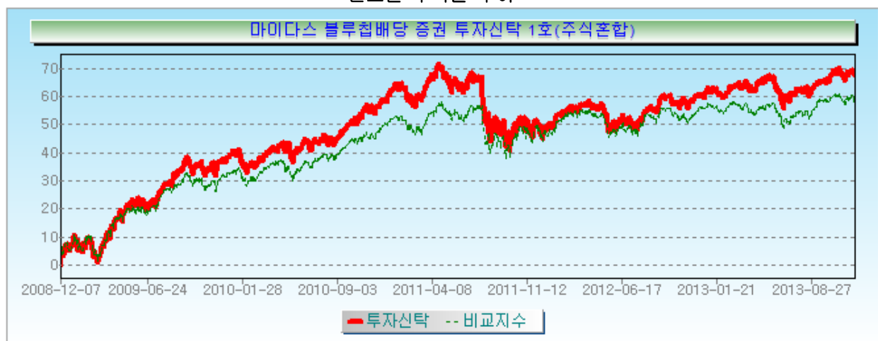
연도별 수익률 추이

* 연도별 수익률은 해당되는 각 1년간의 단순 누적수익률로 투자기간 동안 해당펀드 수익률의 변동성을 나타내는 수치입니다.