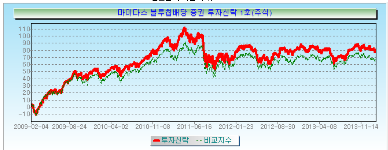
연도별 수익률 추이

* 연도별 수익률은 해당되는 각 1년간의 단순 누적수익률로 투자기간 동안 해당펀드 수익률의 변동성을 나타내는 수치입니다.